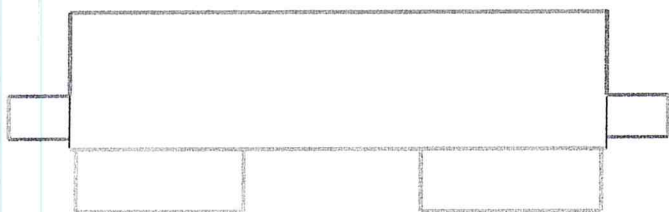
Рис.1 Входная группа Гоголя, 67, вид сверху